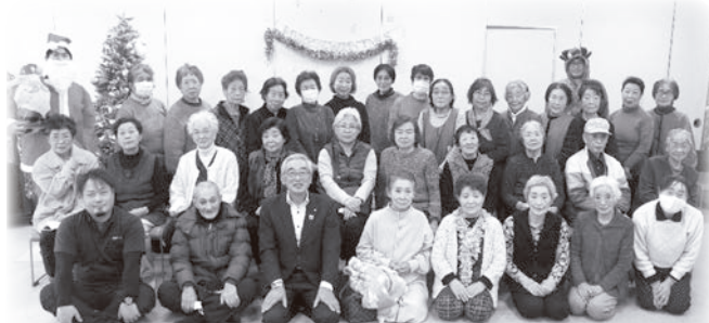
(藤崎地区参加者の皆さん)

一人暮らし高齢者 ふれあい合同昼食会に 今年もサンタクロースと トナカイが来た!