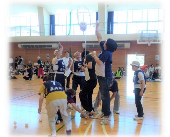
身体障害者スポーツ大会 玉入れ競技