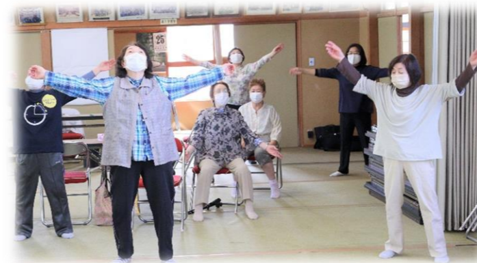
みんなで津軽弁ラジオ体操をしました。 【運動は健康の秘訣！】