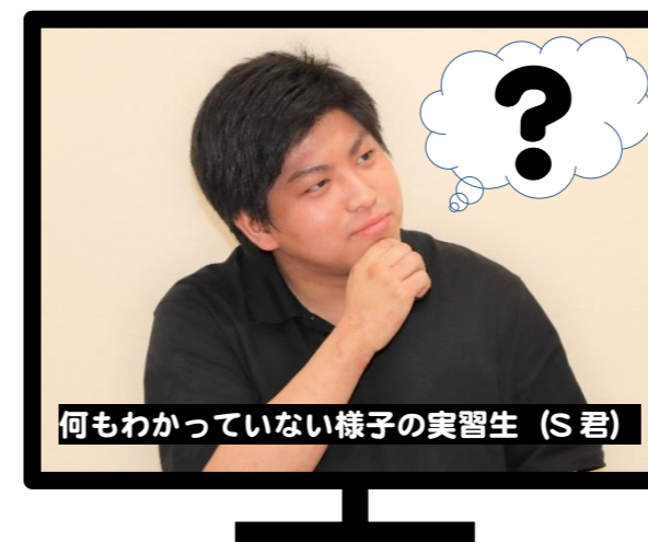
何もわかっていない様子の実習生(S君)