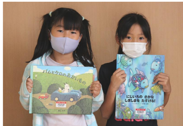
子どもたちに、好きな本を紹介していただきました。

コロナ禍において大変な状況ではありますが、募金活動に住民一人ひとりのご理解とご協力をいただきますようお願い申し上げます。