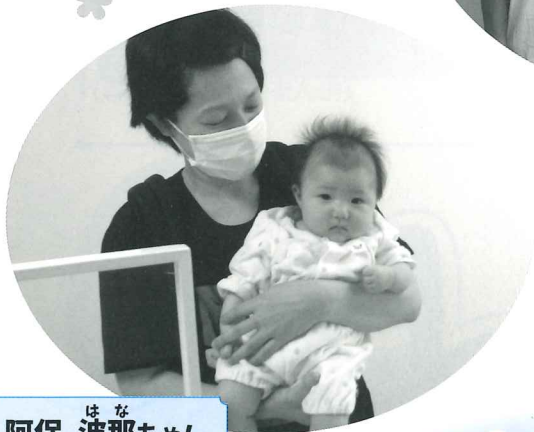
阿保 はな 波那ちゃん (常盤)