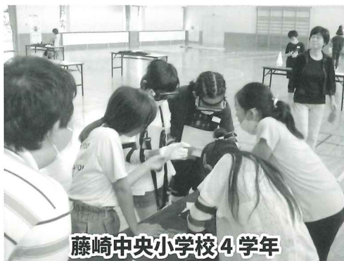
藤崎中央小学校4学年