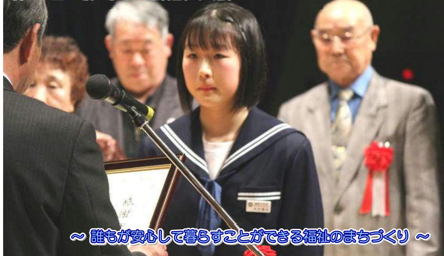
～誰もが安心して暮らすことができる福祉のまちづくり～