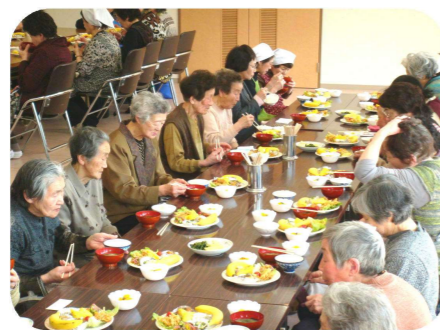
【一人暮らし高齢者屋食会】

毎月1回、一人暮らし高齢者の方を対象に、参加者同士の交流などを目的に行っています。