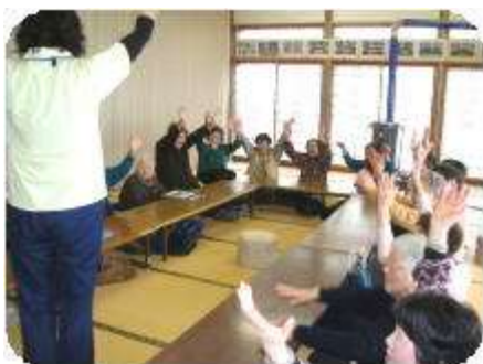
【いきいきふれあいサロン】

◎年会費 1世帯 1,000円 ※「社協一般会費」は下記の事業(抜粋)の一部として使われています。