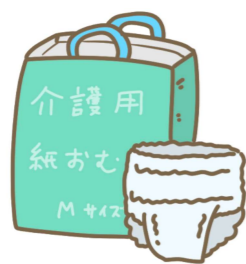
【紙おむつ支給事業】

在宅で紙おむつを使用している高齢者などに対し、状態に応じた紙おむつを支給しています。