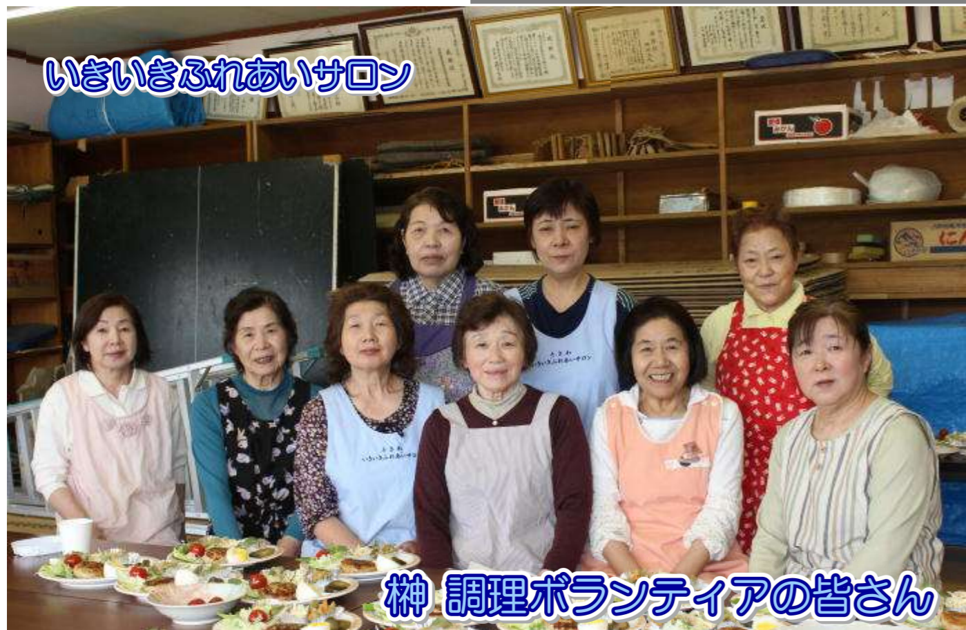
いいききふれあいサロン

〒038-1214 藤崎町大字常盤字富田70-1 (常盤老人福祉センター内) ☎65-2056 FAX69-5262 ✉e-mail: info@fujisakishakyo.or.jp