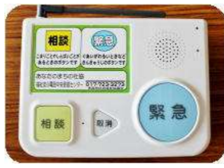
【福祉安心電話サービス事業】

毎月1回、一人暮らし高齢者の方を対象に、参加者同士の交流などを目的に行っています。