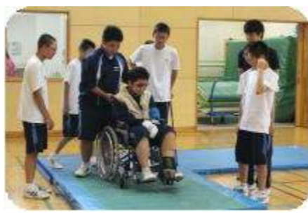
【ボランティア活動事業】