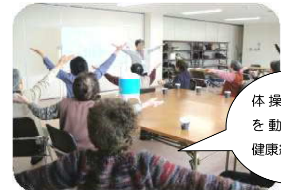
体操で身体を動かして健康維持♪

脳トレ教室は、簡単な読み書きや計算、教材を使った楽習をします。また、軽体操やレクリエーションなどを通して、仲間と交流しながら楽しい時間を過ごしています。