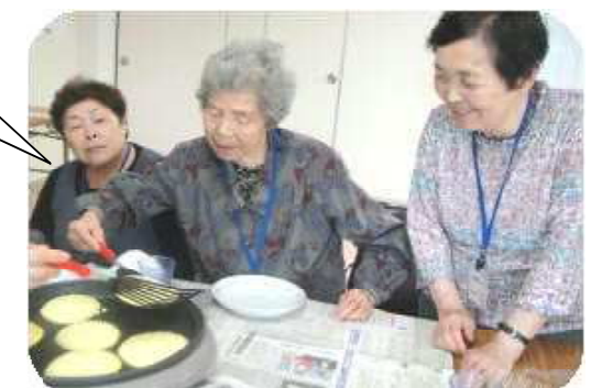
【ホットケーキ作りの様子】