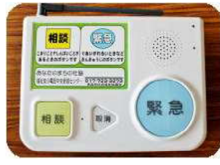
【福祉安心電話サービス事業】

毎月1回、一人暮らし高齢者の方を招待し、参加者同士の交流などを目的に行っています。