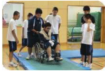
【ボランティア活動事業】