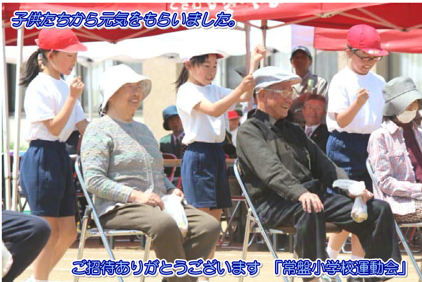
子供たちから元気をもらいました。

〒038-1214 藤崎町大字常盤字富田70-1 (常盤老人福祉センター内) ☎65-2056 FAX69-5262 ✉e-mail: info@fujisakishakyo.or.jp