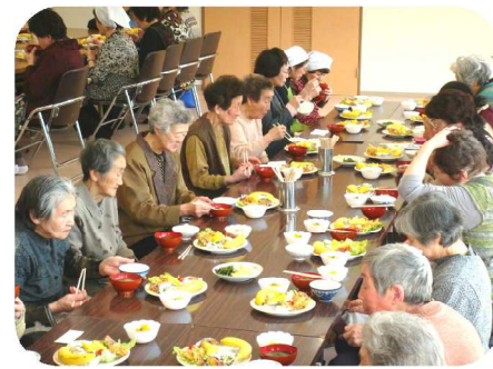
【一人暮らし高齢者昼食会】

毎月1回、一人暮らし高齢者の方を招待し、参加者同士の交流などを目的に行っています。