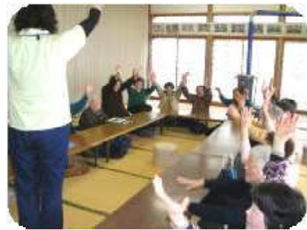
【いきいきふれあいサロン】

◎年会費 1世帯 1,000円 ※「社協会費」は下記の事業(抜粋)の一部として使われています。