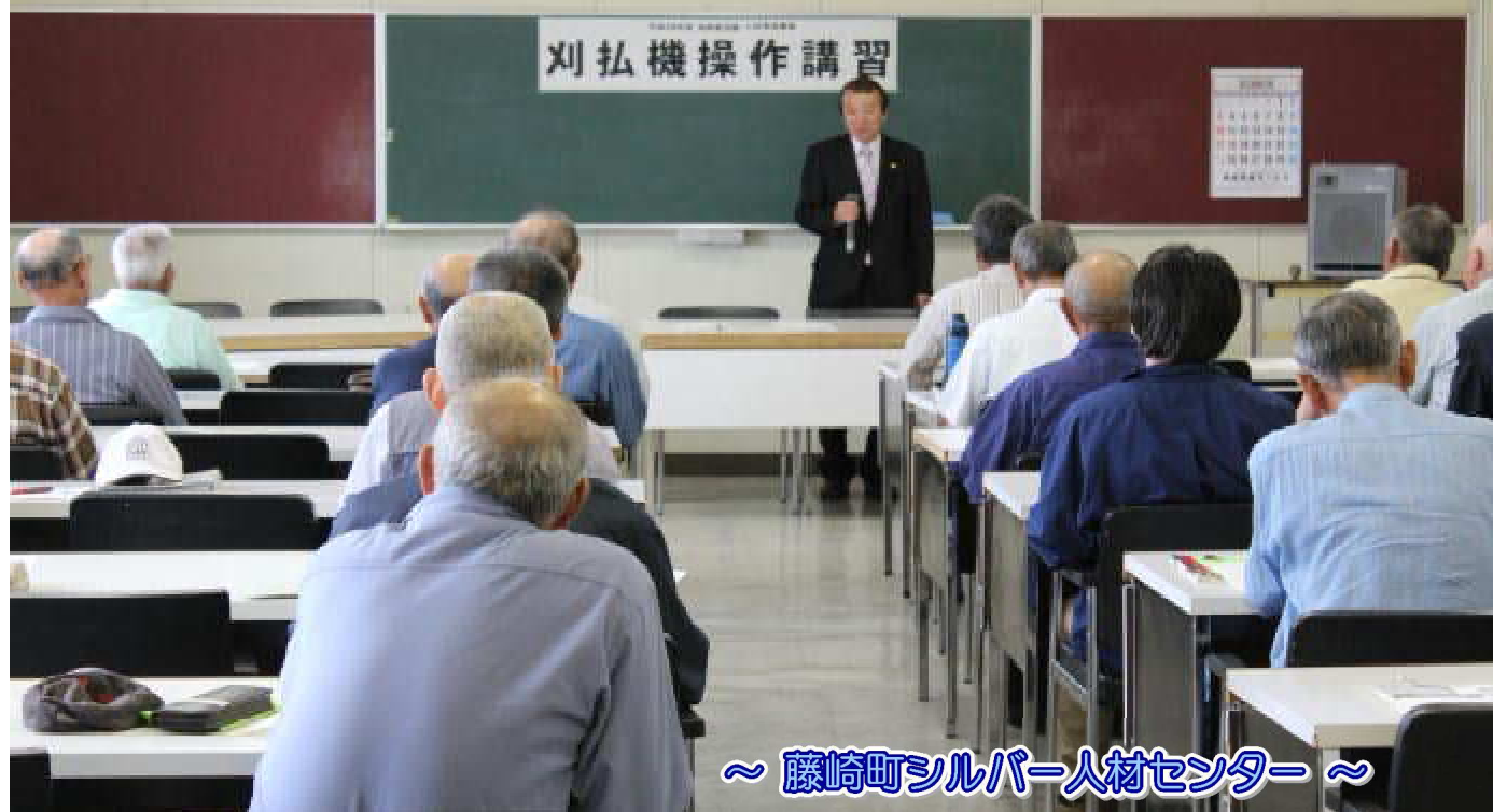
～ 藤崎町シルバー人材センター ～