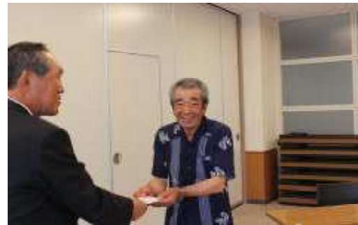
←【75万人目の坂本さん】