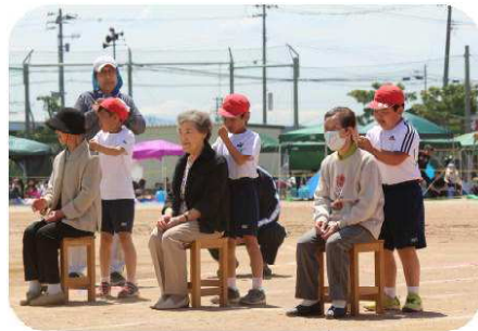
【ボランティア活動事業】