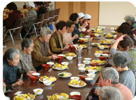
【一人暮らし高齢者昼食会】

毎月1回、一人暮らし高齢者の方を招待し、参加者同士の交流などを目的に行っています。