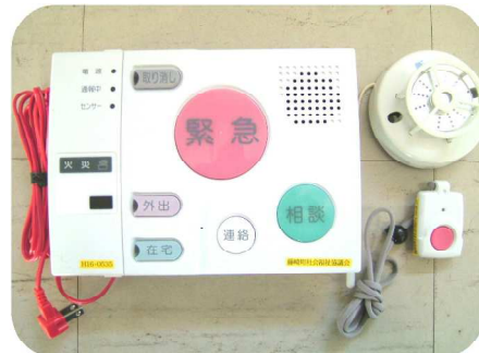
【福祉安心電話サービス事業】

毎月1回、一人暮らし高齢者の方を招待し、参加者同士の交流などを目的に行っています。