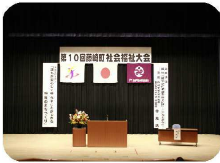
【藤崎町社会福祉大会】