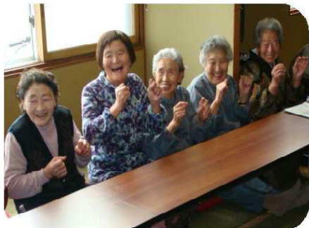
【いきいきふれあいサロン】

◎年会費 1世帯 1,000円 「社協会費」は下記の事業の一部として使われています。