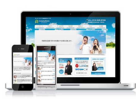
【社協ホームページ】

津軽広域社協が合同で弁護士による法律相談所を開設。管内の複雑な心配ごとに対応します。