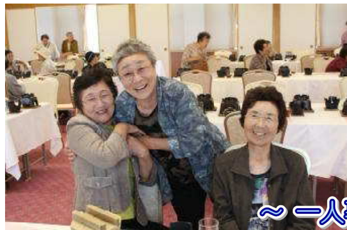
～一人暮らし高齢者 日帰り旅行～