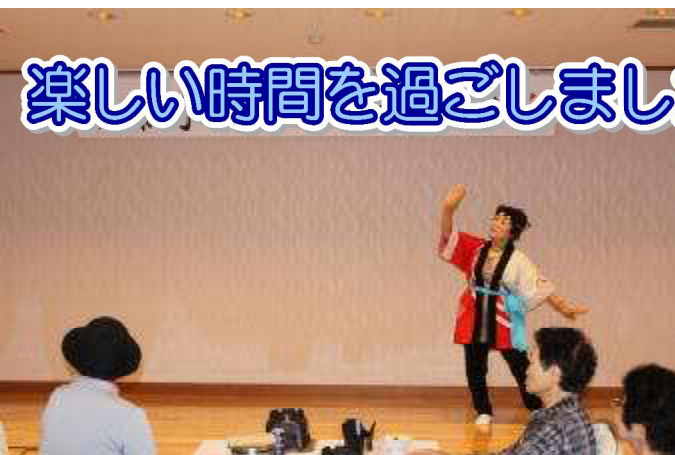
楽しい時間を過ごしました

〒038-1214 藤崎町大字常盤字富田70-1 (常盤老人福祉センター内) ☎65-2056 FAX69-5262 ✉e-mail: info@fujisakishakyo.or.jp