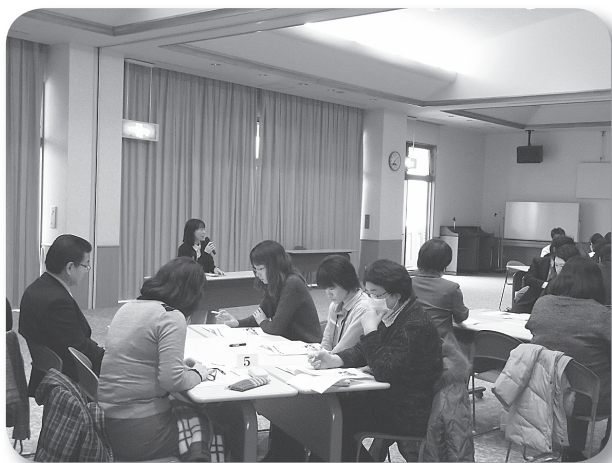
(認知症の理解について講義)