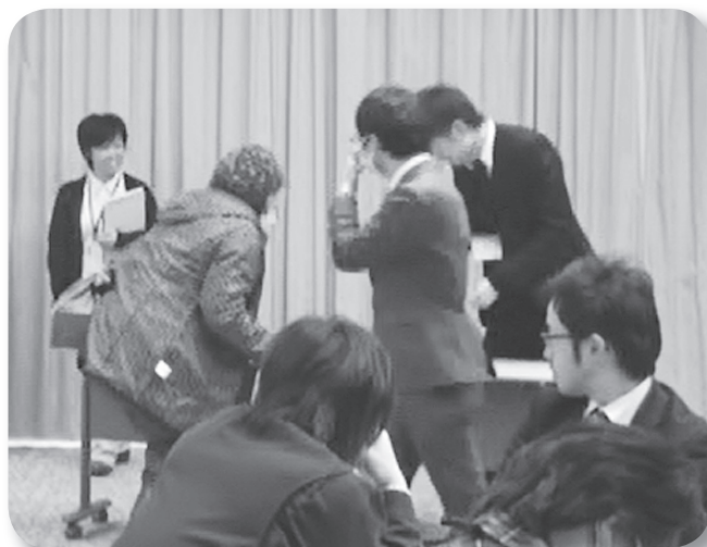
(メイトのおばあさん役と実践練習)